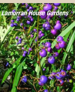
Lamorran House Gardens

14.07.: Gleich am Morgen besuchen wir heute „ Cottage Garden “, einen Privatgarten, der Ideenreichtum und Wohngefühl wunderbar verbindet. Professionelle Ansprüche werden umgesetzt, aber nicht übertrieben, die Vielfalt dieses Idylls zählt von bunten Staudenbeeten, über den Steingarten mit Vaters Gedenkstein (102 Jahre alt wurde er!) bis zum geplanten Koniferengarten. Sehr hübsch ist auch das Pflanzenhospital. Anschließend erleben wir einen Garten, den wir vielleicht erst auf den zweiten Blick als solchen erkennen werden. „ Pinetum Garden “ umfasst insgesamt zehn