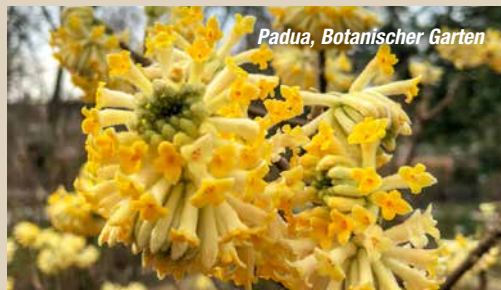
Padua, Botanischer Garten