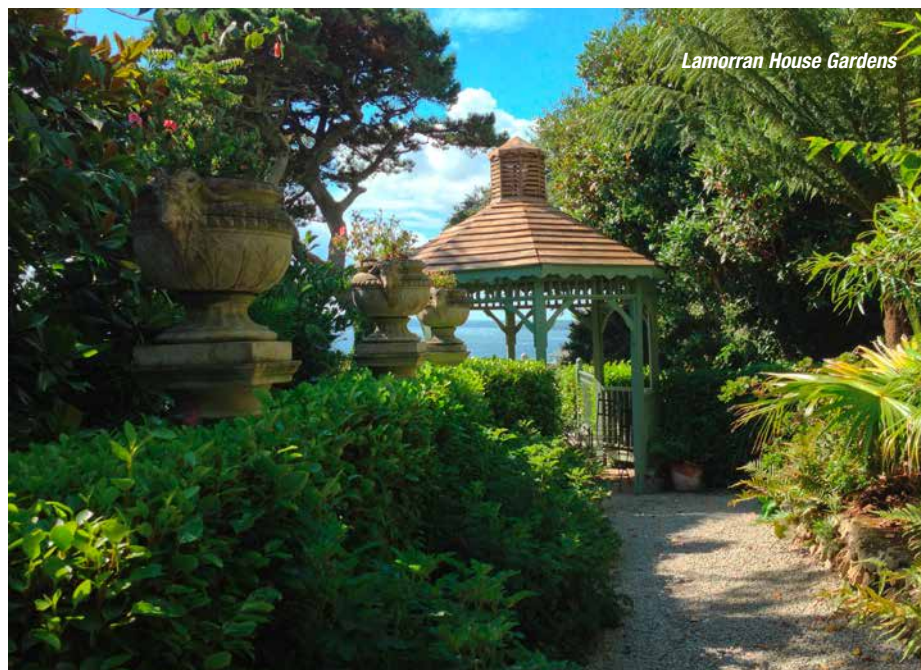
Lamorran House Gardens