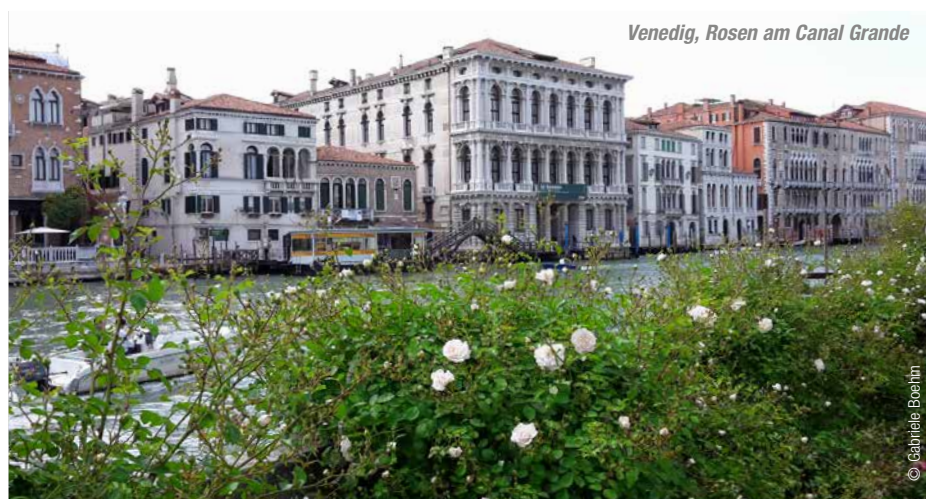
Venedig, Rosen am Canal Grande