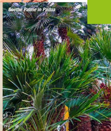
Goethe Palme in Padua

Mehr Tipps gibt's auf www.biogaertner.at