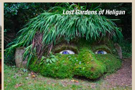
Lost Gardens of Heligan