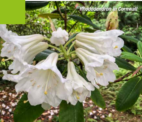
Rhododendron in Cornwall

England darf auch im 29. Jahr der Gartenreisen nicht fehlen!