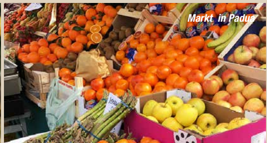
Markt in Padua