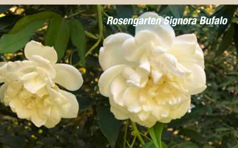
Rosengarten Signora Bufalo

07.05.: Mit dem römischen Linienbus erreichen wir am Morgen direkt vom Hotel den Circus Maximus. Nach einem kleinen Spaziergang auf dem Hügel des Aventin erwartet uns zu Beginn dieses Reisetages der GARTEN DES PRIORATS DES SOUVERÄNEN MALTESERORDENS. Weltberühmt sind die Fotografien unzähliger Touristen, die durch das Schlüsselloch des eisernen Tores die Kuppel von Sankt Peter fotografierten. Für uns öffnet sich das Gartentor und wir haben die Gelegenheit, den zauberhaften „geheimen Garten“ mit seinen wunderbaren Aussichten auf den Vatikan zu genießen. Unser zweiter Garten ist der kommunale Rosengarten der Stadt Rom. Direkt am Aventin mit Blick auf den Circus Maximus finden wir eine riesige Auswahl verschiedenster Rosen. Der Park wurde 1931 angelegt und seitdem werden über 1000 Rosensorten angebaut. Danach steht der GARTEN DER VILLA MEDICI, den wir leicht mit der U-Bahn erreichen, auf dem Programm. Dieser ist nahe der Trinita dei Monti auf dem Picino gelegen und ist seit 1083 Sitz der Académie des Beaux Arts. Dort wird uns im noblen Ambiente ein Aperitiv und Mittagssnack gereicht. Im französisch/italienischen Stil angelegt, begeistert der Garten auch durch traumhafte Blicke auf die ewige Stadt. Zu seinen Füßen liegt die Spanische Treppe und die Altstadt, die am Nachmittag zum individuellen Besuch einlädt. Mit dem inkludierten Öffi-Ticket an diesem Tag bieten sich aber auch noch andere Möglichkeiten.