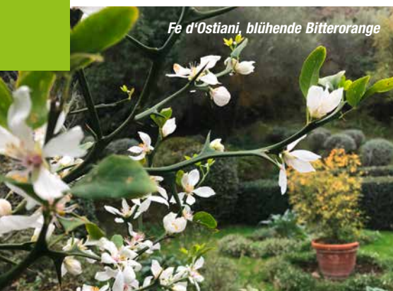
Fé d'Ostiani, blühende Bitterorange

Eine Gartenreise in die italienische Metropole stellt ein besonderes Erlebnis dar. Alte historische Parkanlagen genauso wie kleine versteckte private Gärten in der Stadt, aber auch große romantische Anwesen am Land mit Bächen, Bäumen und üppigen Beeten stehen auf dem Programm. Gepaart mit italienischer Gastfreundschaft wird aus kleinen Gartenparadiesen ein kulinarisches Schlaraffenland. Hier geht die Liebe im wahrsten Sinne des Wortes durch den Magen – das alles zur Zeit des italienischen Frühlings und der Rosenblüte. Bequeme, sichere und ökologisch vertretbare Anreise ab/bis OÖ, Salzburg und Tirol mit dem sabtours -Bus, der uns auch in Rom's Umgebung und in Umbrien von Garten zu Garten bringt.