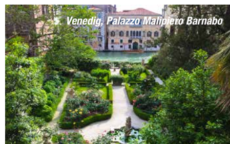
Venedig, Palazzo Malipiero Barnabo