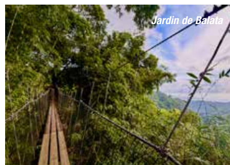
Jardin de Balata