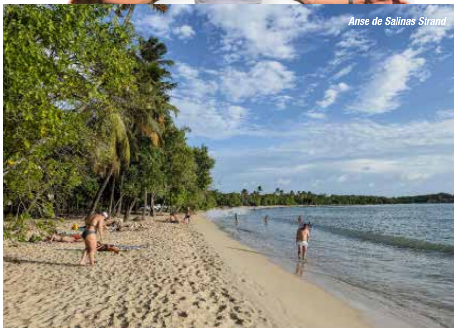
Anse de Salinas Strand