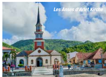
Les Anses d'Arlet Kirche