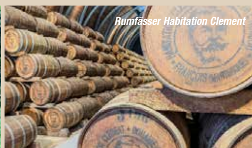
Rumfässer Habitation Clément